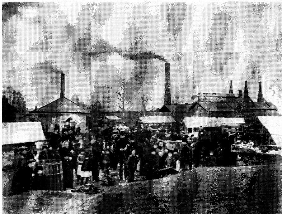
Torget vid början av 1870-talet.

Vilka var det nu som befolkade torget? Jag skall kanske börja med de kvinnliga gårdfarihandlarna. De sågo urgamla ut men voro nog rätt unga.