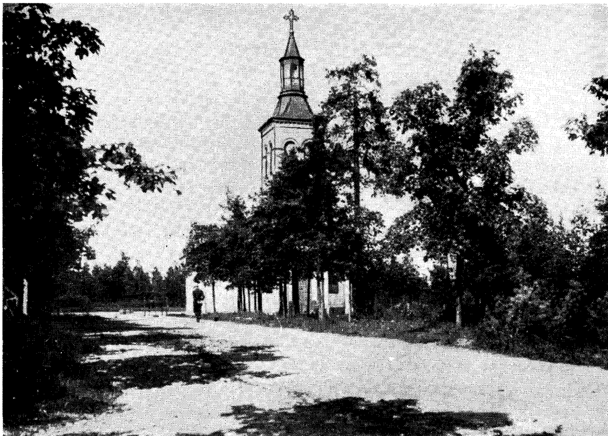
Sandvikens kyrka. 1880-talet.

i brukspatronsgården fingo vackert hålla oss hemma i vår egen kyrka eller på 1870-talet i bönhuset. Men den stackars prästen var det synd om, förstår jag nu. Den gamla brukskyrkan hade prediksstolen i koret över altaret och där bakom sakristian. När folket på julmorgonen stod packat inte endast i gången utan även ute på trappan och inne i sakristian med dörrarna vidöppna på båda hållen, stod prästen minsann i "blåsväder", 'Jag minns, huru ljusen vid första bänkraderna och i fönstren flämtade, osade och runno, och snön faktiskt yrde in. Kyrkvaktaren hade gått i gårdarna och samlat ihop ljusen - så enkelt gick det till!' Men jag tror, att den tidens jul firades allvarligare och intensivare än nutidens, koncentrerad som den var till själva högtiden - från november- och decembermörkret till julaftonens och juldagens levande ljus.