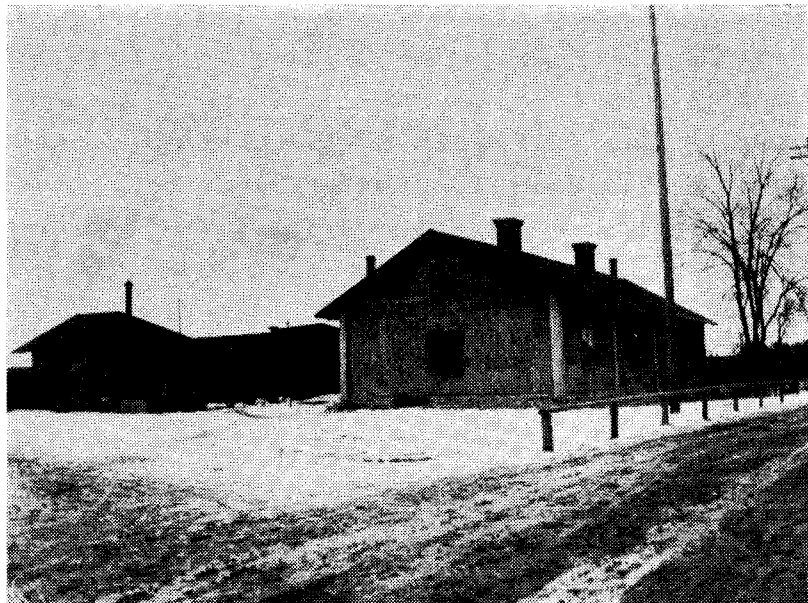
Värdshuset och "Futten".